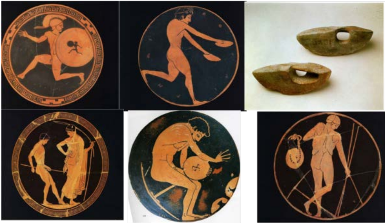
Hoplita, saltador de longitud, halteras para saltar, lanzador de disco y acontes.