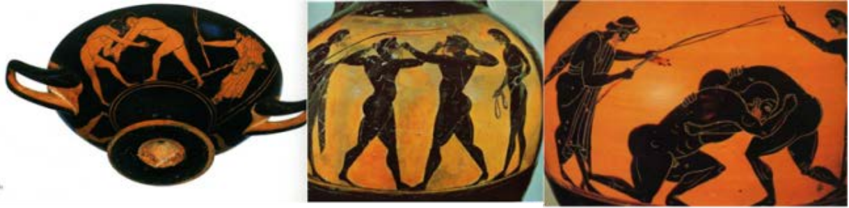
Lucha, pugilato y Pancraccio

La organización de los Juegos Olímpicos. Los primeros Juegos Olímpicos comenzaban con una fiesta en el santuario de Olimpia en honor a Zeus y a su harén de mujeres rubias, pertenecientes al templo, que se prostituían por un real.