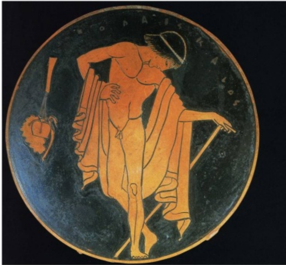
Efebo con bastón y bolsa de ungüentos

En el 395 d.C. los bárbaros invadieron y saquearon Olimpia y en el 408. Teodosio II y Honorio emperadores romanos de occidente y oriente, decretaron la destrucción de los templos y lugares dedicados a dioses paganos. Supuso la destrucción de los juegos y del ideal educativo en el que el cuerpo tenía protagonismo, para ser reducido por motivos de la religión y por la visión cristiana del cuerpo como origen de pecado. El dualismo filosófico, estableció un sistema de porcentajes, en los cuales, la reducción de la mitad cuerpo, engrandecía a la mitad alma.