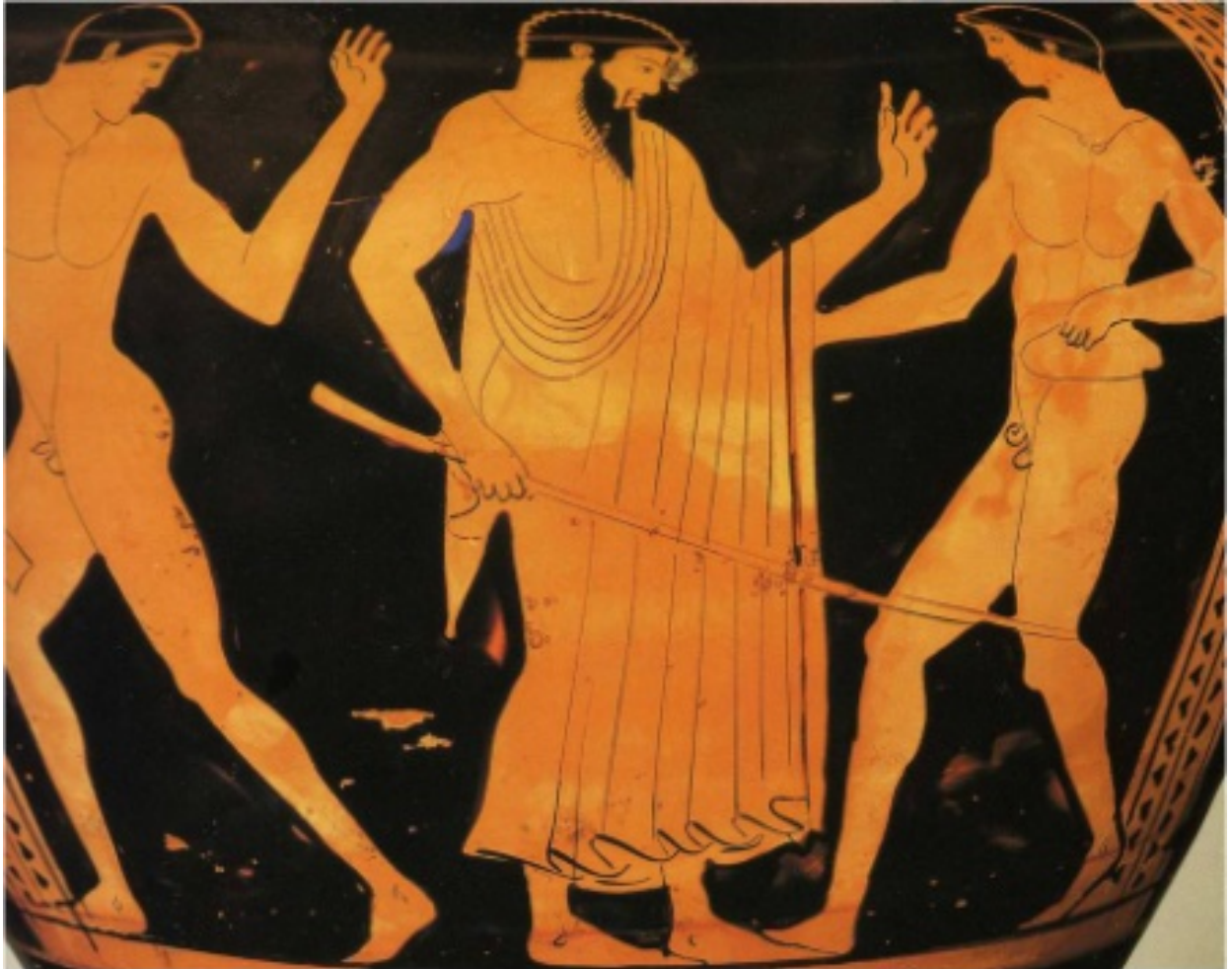
Corrección de la pierna de salto por un profesor